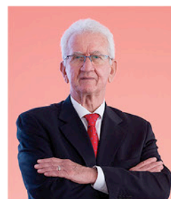
Great Place to Work Equipa

A Green Media, para mim acaba por ser uma empresa de comunicação, com quem eu tenho todo o gosto de trabalhar e com quem eu sinto uma relação afectiva e emocional bastante grande. Acho que a Green Media é um elemento fundamental, não só pelo trabalho que desempenha, como também tem uma consciência social, ecológica, humana que muito raramente se encontra neste país e este, sem dúvida, é o seu ponto forte.