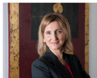
Conceição Pinto Rosa Sociedade de Advogados SM&SB

"A Green Media tem, ao longo do tempo, tem dado provas constantes da sua grande visão comunicacional. Uma empresa composta por profissionais competentes e incansáveis no que diz respeito aos projetos aos quais se propõem. É um gosto trabalhar com uma equipa tão criativa e dinâmica."